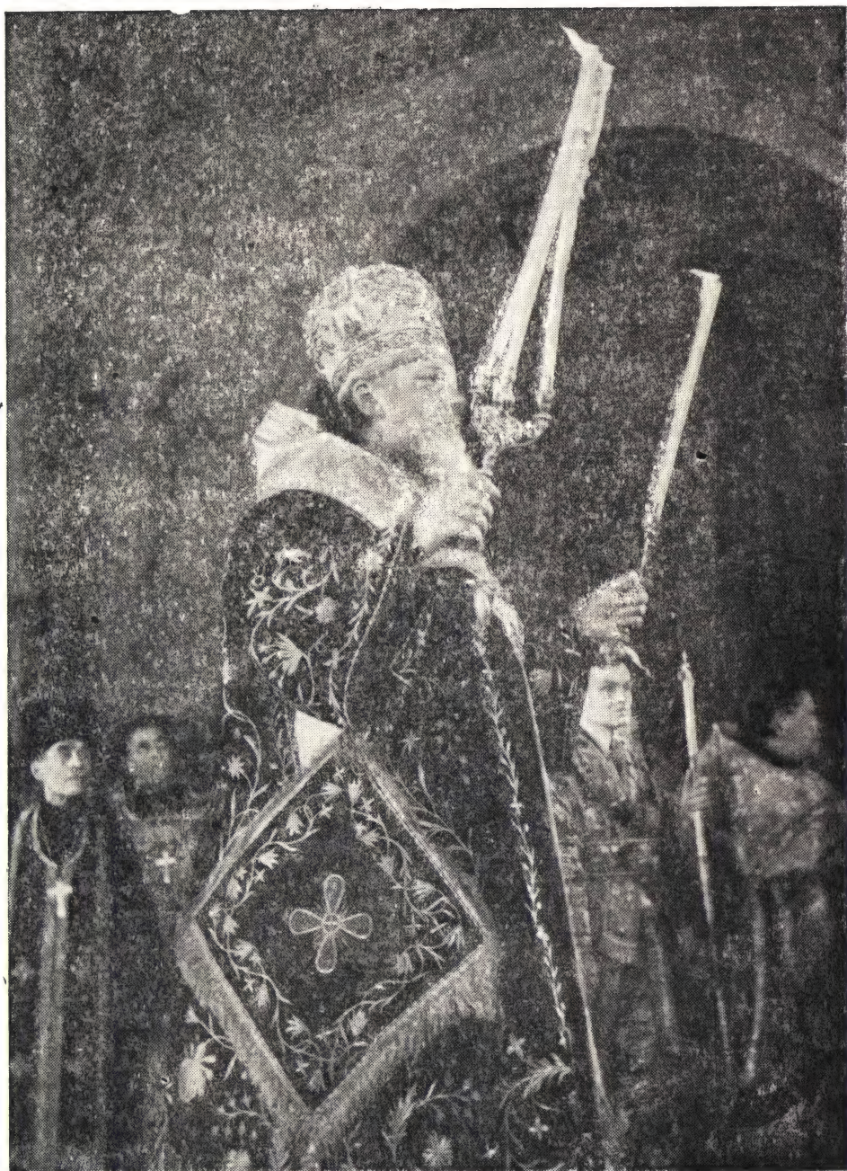
СВЯТЕЙШИЙ ПАТРИАРХ АЛЕКСИЙ В БОГОЯВЛЕНСКОМ СОБОРЕ В ДЕНЬ СВОЕЙ ИНТРОНИЗАЦИИ